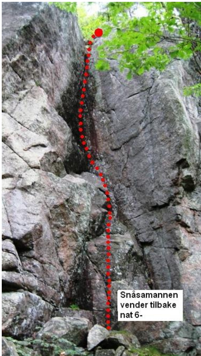
Snåsamannen vender tilbake nat 6-