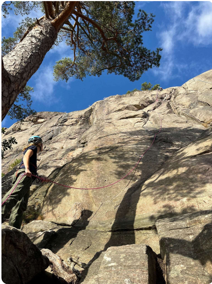
Klubbklatring på Odderøya tirsdag 30.august.