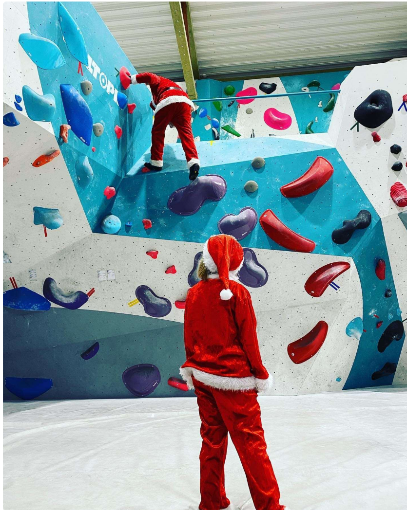
Nisser i full fart!

ruter ble skrudd opp. Mange takk til dugnadsgjengen som sto på! Sjekk gjerne ut instagram-kontoen vår for bilder av de nye rutene.